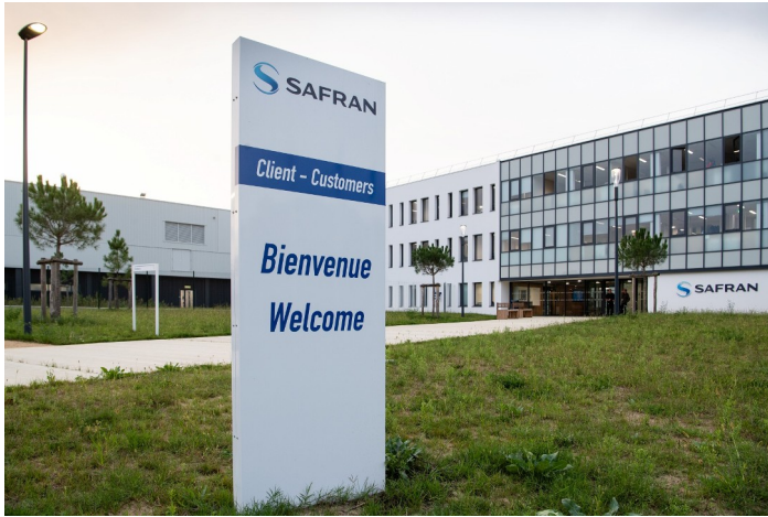
55 avenue du 1er Mai, 40220 Tarnos.